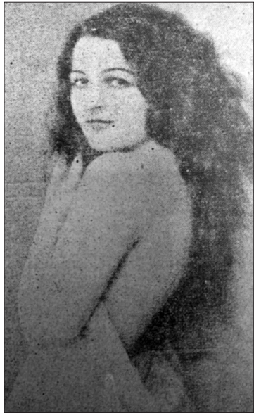
– Μπες μέσα, γουρουνάκι...