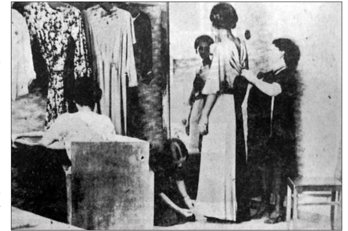
Το μοδιστράδικο ήταν ψεύτικο. Οι κυρίες δεν πήγαιναν εκεί για να ντυθούν, αλλά για να... γδυθούν!

»Το μοδιστράδικο βρισκόταν σε μια πάροδο της οδού Μητροπόλεως. Μια μικρούλα ως 15 χρονών ήρθε να μας ανοίξη. Ήταν προκλητικά ντυμένη. Ένα φορεματάκι πράσινο ήταν σφικτά εφαρμοσμένο επάνω της. Ζήτημα ήταν αν φορούσε ένα πουκαμισάκι από κάτω. Εκείνο που πρόσεξα αμέσως ήταν τα στήθη της. Φαινόταν όρθια. Δεν φορούσε σουτιέν. Περνώντας μέσα, δίχως να το θέλω, το χέρι μου εσύρθηκε επάνω των. Ένιωσα τον ζεστό παλμό τους και κατάλαβα πως από το φως τα χώριζε μόνο αυτό το κρεπ ντε σιν... Αρχίζαμε πολύ ερεθιστικά. Η μικρούλα